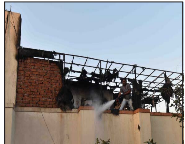
अहमदाबाद शहर के आश्रमरोड गांधीग्राम रेलवे स्टेशन के पास इमारत के छत पर रेस्टोरेंट में आग लगने से भगदड़ मच गई।