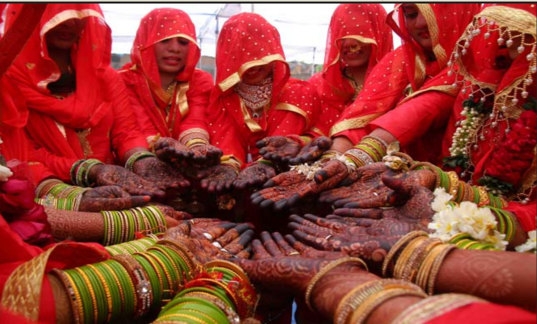
अहमदाबाद शहर के गोमतीपुर टोपी मिल में गुजरात सार्वजनिक वेलफेयर ट्रस्ट द्वारा समूह निकाह का आयोजन किया गया। (संपूर्ण समाचार सेवा)

बीआरटीएस के रोजाना १.६० लाख पैसेन्जर्स होने से इसमें कुल १६३ बस स्टेशन को जोड़ना १०१ किमी. का ऑपरेशनल एरिया है। बीआरटीएस रोजाना २५५ बस पैसेन्जर्स के लिए चला रही होने से प्रशासन को हररोज २१ लाख रुपये का मुनाफा होता है। हालांकि प्रशासन द्वारा जारी किए गए नीविदा में ३०० बस तथा कुछ ही दिनों में आनेवाली १०० इलेक्ट्रिक बस में वाईफाई की सुविधा देने की बात को शामिल किया गया है। हरएक बीआरटीएस बस में वाईफाई की सुविधा देने के लिए राउटर लगाया जाएगा। वाईफाई जर्नेट होने की वजह से इस्तेमाल की गई बेन्डविथ के आधार पर इसकी कीमत चुकानी पड़ेगी।