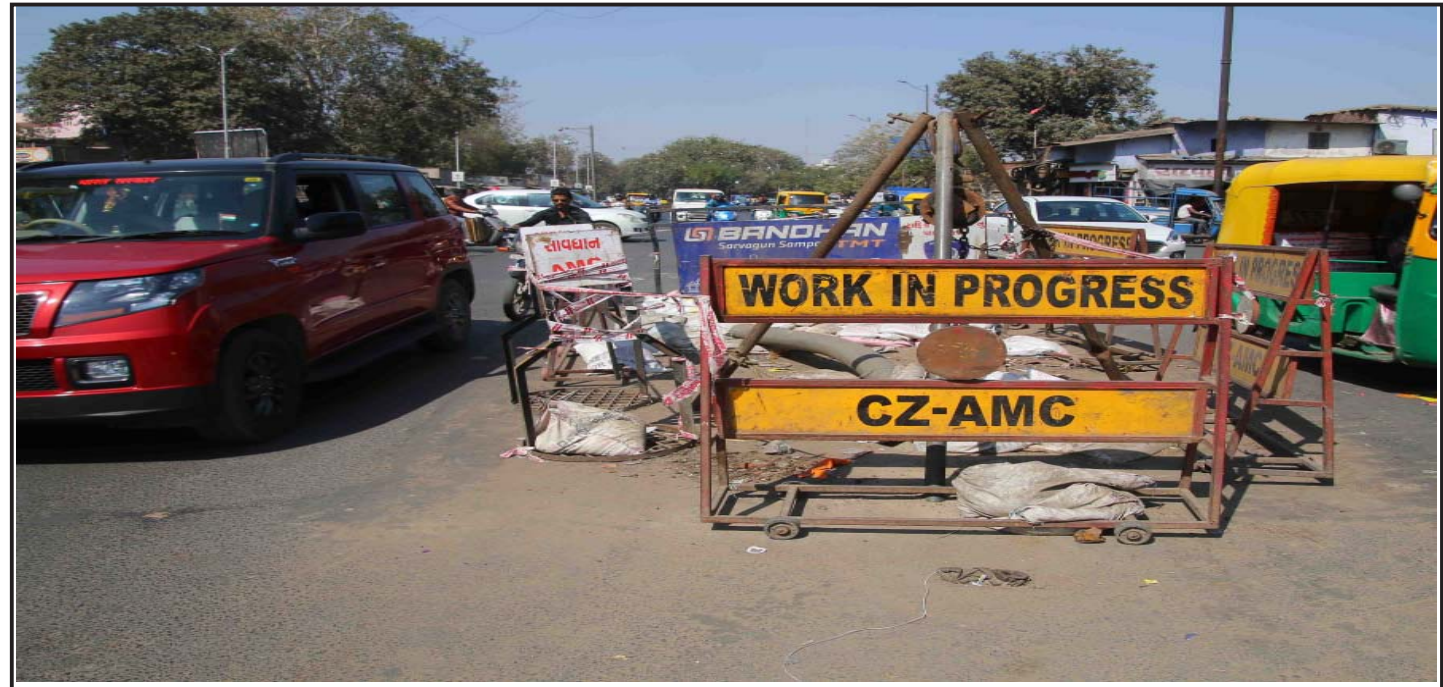
अहमदाबाद शहर के प्रेमदरवाजा कालुपुर रोड पर एएमसी द्वारा काम शुरू किया गया। जिसकी वजह से ट्रैफिक की समस्या खड़ी हो रही है। हालांकि वैकल्पिक व्यवस्था की गई है। (संपूर्ण समाचार सेवा)

स्वाइन फ्लू के कुल केस ..... ७३८ से ज्यादा स्वाइन फ्लू से मौत ..... ३८ से ज्यादा स्वाइन फ्लू से मौत ..... ३८ से ज्यादा उपचार के तहत लोग ..... २९० से ज्यादा