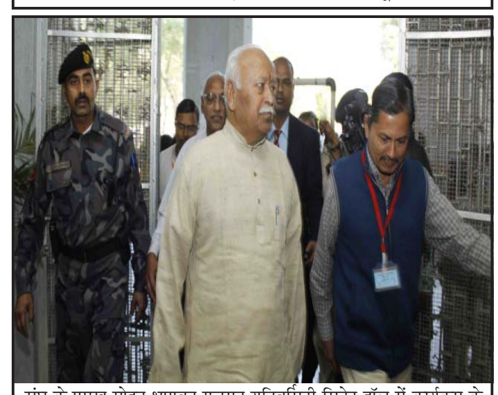
संघ के प्रमुख मोहन भागवत गुजरात यूनिवर्सिटी सिनेट हॉल में कार्यक्रम के तहत पहुंचे।